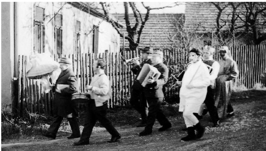
Ostatkový průvod kolem roku 1970

V roce 1993 uspořádal tradiční pouť a v červnu se zúčastnil soutěže okrsku ve Vavřinci. Ta proběhla v rámci oslav 100. výročí založení místního sboru a sbor se umístil v kategorii do 35 roků na 3. místě z 11-ti startujících. Dále se požární družstvo zúčastnilo soutěže ve Žďáru. Během roku byly neustálé problémy se stříkačkou PS 8 (oprava na Klepačově).