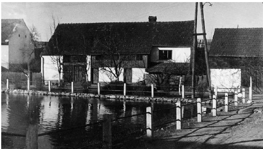
Horní rybník po opravě v roce 1949

Rok 1949 – oprava horního rybníka. Ten byl odbahněn a zmenšen. Jeho původní kruhový tvar změnili na tvar obdélníkový se zaokrouhlenou horní stranou.