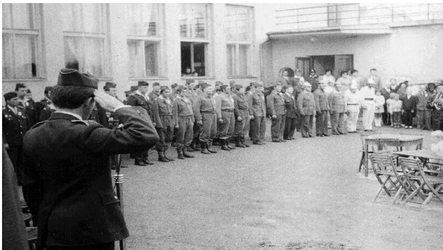
Slavnostní nástup při oslavách 50. výročí založení sboru v roce 1971

založení sboru na Těchově a v prosinci ještě uskutečnil zájezd do Prahy na výstavu 50. výročí vzniku SSSR.