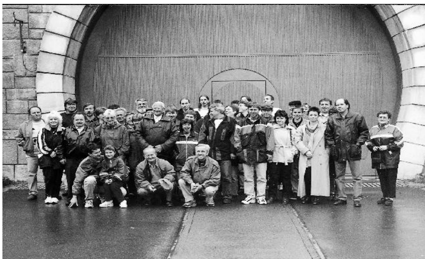
Účastníci zájezdu na přečerpávací elektrárnu Dlouhé Stráně v Jeseníkách