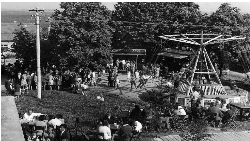
Výletišťe v Malé Veselici