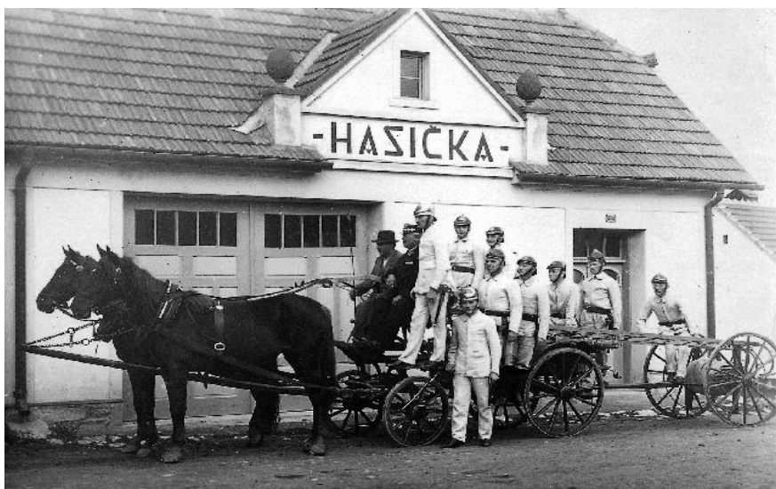
Činní členové sboru v roce 1938.