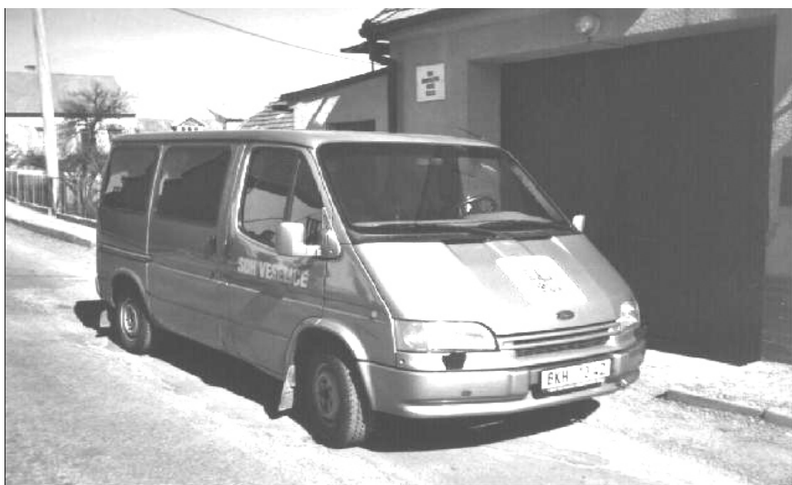
Požární vozidlo Ford Transit