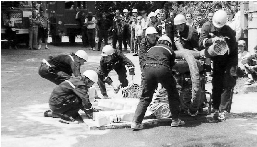
Družstvo sboru v akci při „Poháru“ ve Veselici v roce 2000