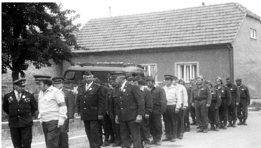
Nástup při námětovém cvičení v roce 1982

V roce 1984 se sbor zúčastnil soutěže okrsku ve Vysočanech, která se uskutečnila v rámci oslav 90. výročí založení místního sboru. Předtím však uspořádal tradiční pout' a v červenci se zúčastnil na soutěži ve Žďáru.