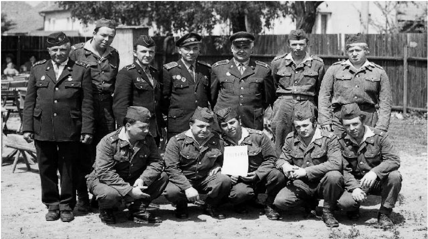
Po okrskové soutěži v Němčicích v roce 1973

Např. v roce 1975 se sbor umístil na 94. místě ze 160 organizací v okrese. Podstatně lépe v té době byl hodnocen okrsek Sloup, který v samostatném hodnocení okrsků obsadil 1. místo. Za toto umístění, které bylo již třetí za sebou, obdržel standartu, která byla vystavena i ve Vavřinci na MNV. Okrsková soutěž se v tomto roce uskutečnila ve Vavřinci, ale družstvo z Veselice se jí nezúčastnilo. Členové sboru provedli preventivní prohlídky, jejichž výsledkem byla i evidence plynových spotřebičů - vařiče a sporáky na propanbutan v požárním plánu obce.