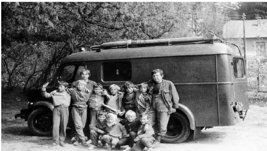
Družstvo mládeže před požárním vozem zn. AERO 150